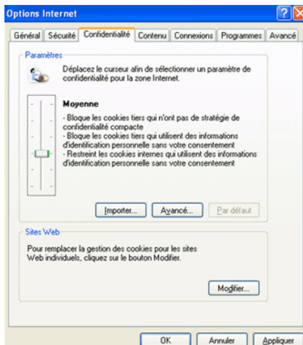
Boîte de dialogue Options Internet

Soyez prudent ! Si vous choisissez de bloquer tous les cookies, vous ne pourrez pas profiter des fonctionnalités de personnalisation des sites et il vous sera même impossible de visiter certains sites.