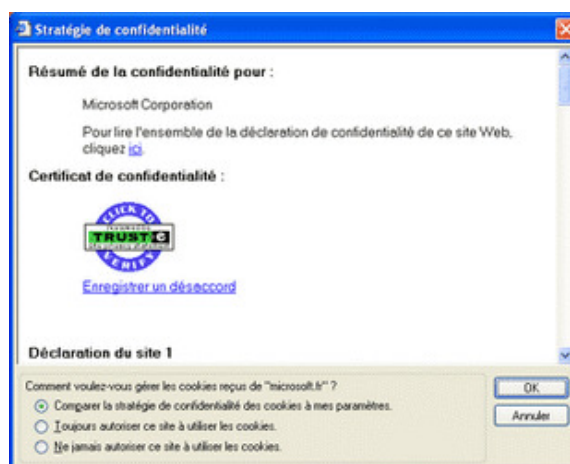
Boîte de dialogue Rapport de confidentialité